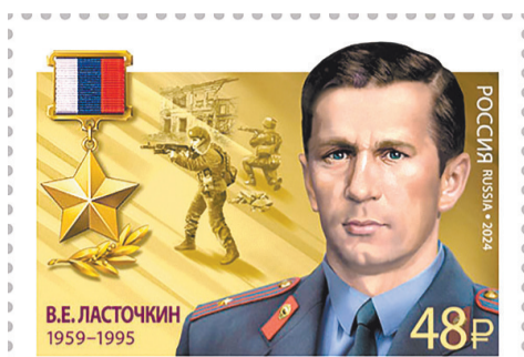
Почтовая марка в память о Герое России В.Е. Ласточкине

Александр ТАРАСОВ